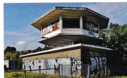
seinhuis in Nijmegen.

op hun beurt overbodig geworden. Deze seinhuizen hebben een veel zakelijker uitstraling, waardoor sloop minder weerstand oproept. Toch blijven het typische gebouwtjes, kenmerkend voor een bepaalde functie in een bepaalde tijd. De CVL-posten markeren de overgang van de klassieke naar de geautomatiseerde beveiliging. Door hun functie zijn het opvallende gebouwtjes, in een stijl die typerend is voor de wederopbouw en de jaren 1960.